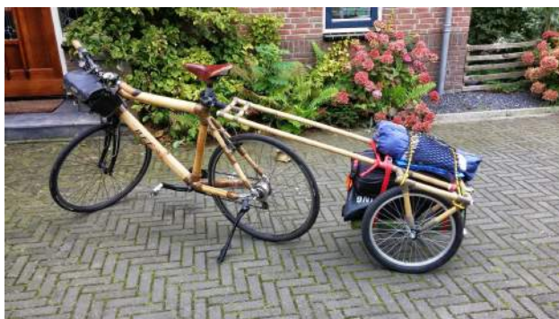
Snelle stadsfiets met aanhanger